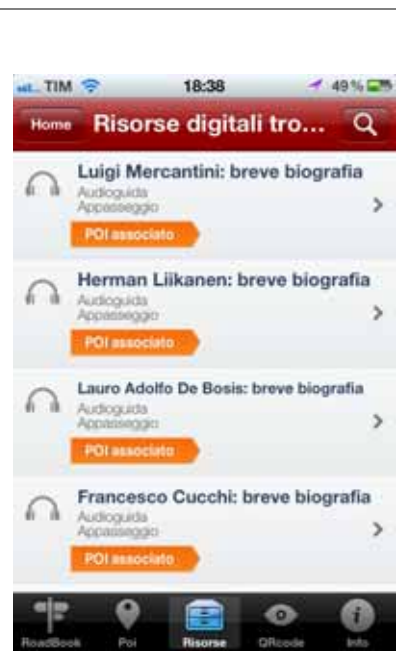
Risultato ricerca risorsa digitale