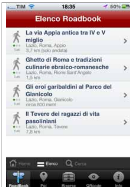
Elenco degli itinerari