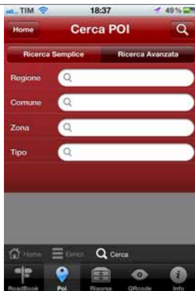
Punto d'interesse: ricerca avanzata