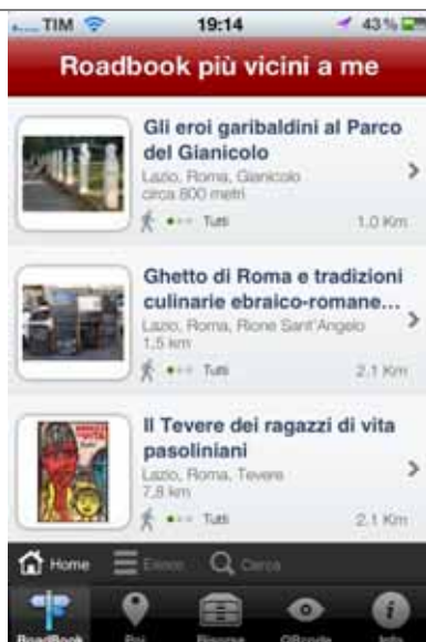
Elenco itinerari più vicini all'utente, con indicazioni del titolo, Regione, Città, Zona/Località, Tipologia, Difficoltà, Utenza, Distanza

In caso di risposta affermativa, sarà possibile visualizzare la distanza degli itinerari memorizzati dalla propria posizione.