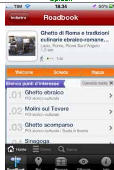
Itinerario selezionato con elenco dei punti d'interesse