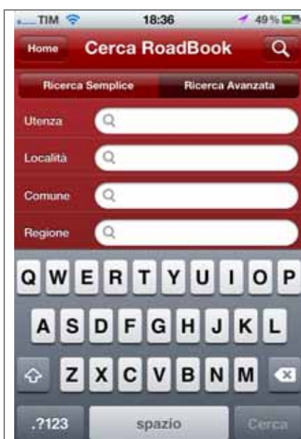
Itinerari: Ricerca avanzata