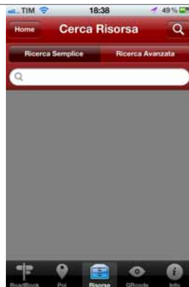
Risorsa digitale: ricerca semplice