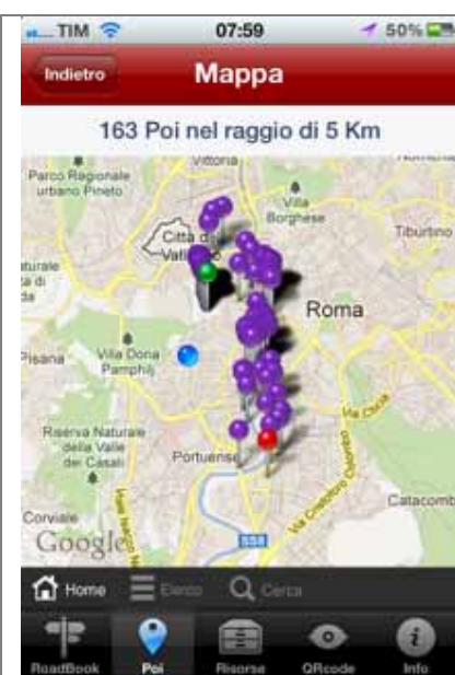
Cliccando Mappa vicini nello screenshot precedente, si visualizza la mappa dei POI più vicini all'utente nel raggio di 5 chilometri