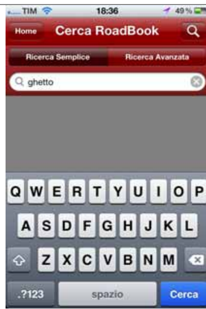
Itinerari: Ricerca semplice