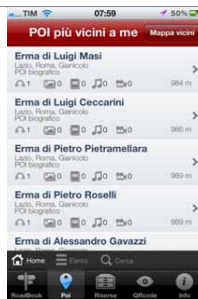
Elenco dei punti d'interesse più vicini all'utente con indicazione delle risorse disponibili (audio, immagini, testi, musica, video)