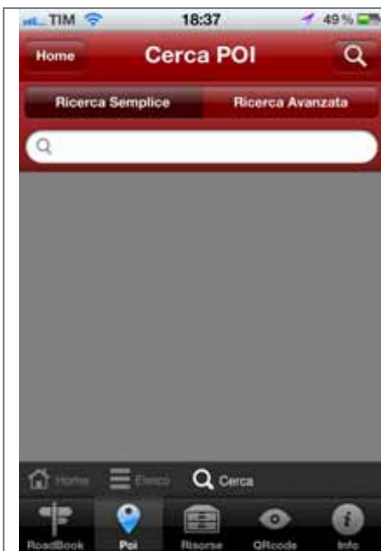
Punto d'interesse: ricerca semplice