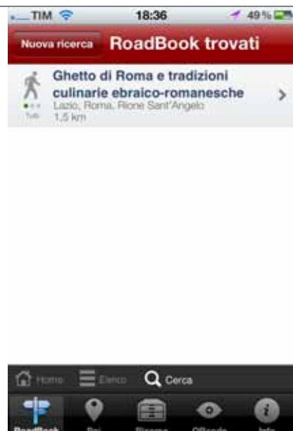
Itinerari: Risultato della ricerca semplice