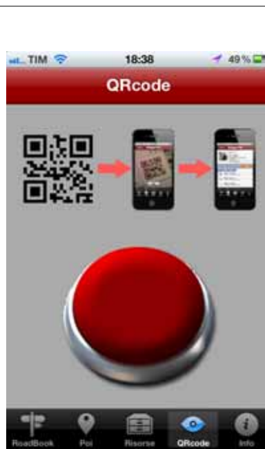
Applicazione per la lettura del QRCode